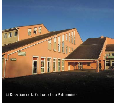
© Direction de la Culture et du Patrimoine