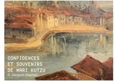
CONFIDENCES ET SOUVENIRS DE MARI KUTZU