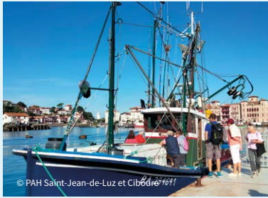
© PAH Saint-Jean-de-Luz et Ciboure 6674611